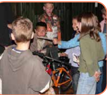
ACE Aktion Hell und Dunkel beim Event Mobilität 2006 im FEZ Berlin